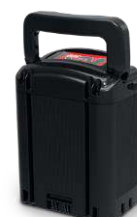
NX300 Batería Ref.: 909996

Contacto máximo con el suelo y revestimiento interior duro para un secado total. Reversible, uso en ambos lados. Suministrado en pack de 2 unidades. Ref.: 913810