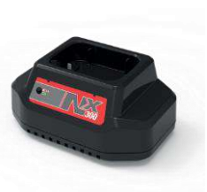
NX300 Cargador Ref.: 911334